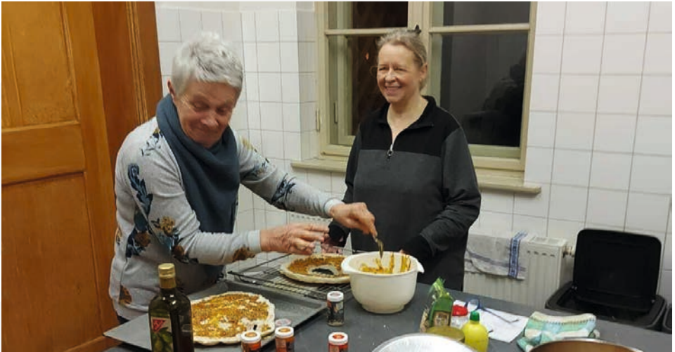
Kochen mit der Bibel