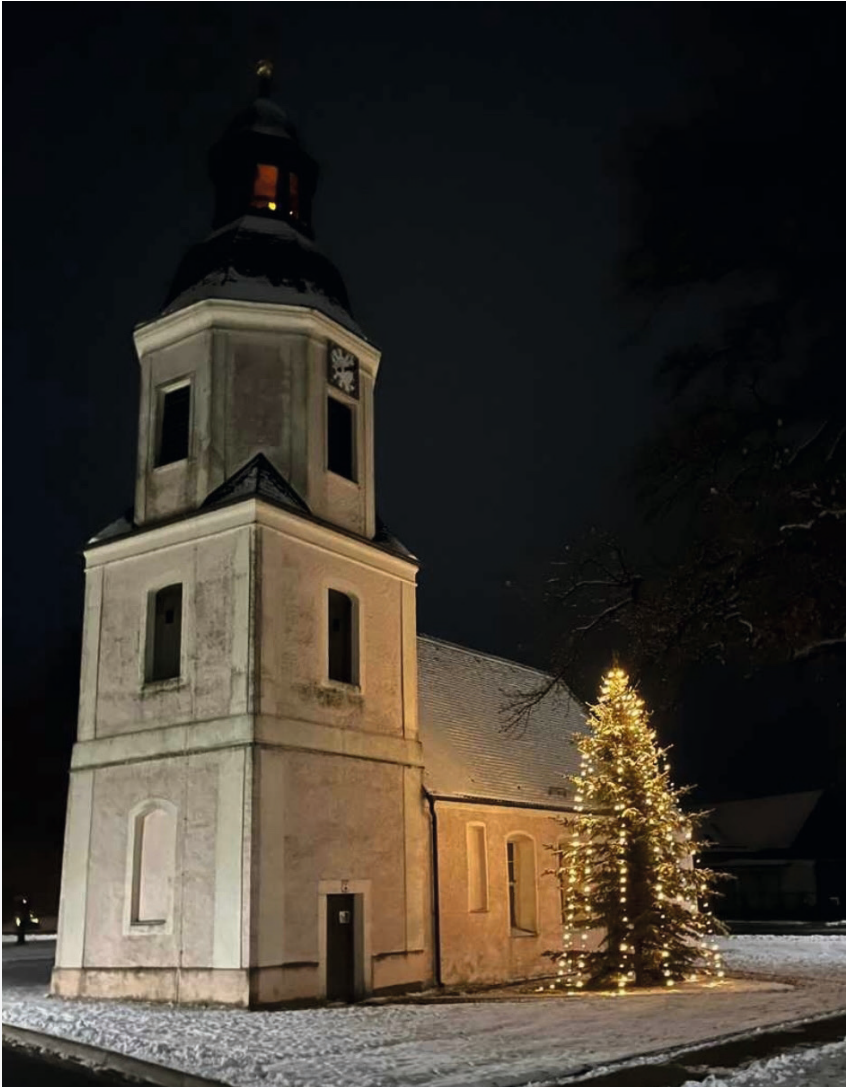
Weihnachten an der Schützberger Kirche