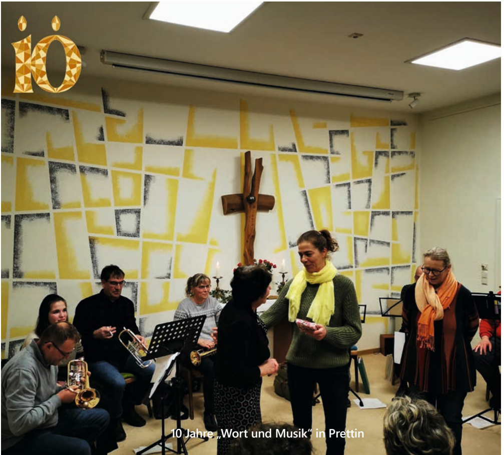
10 Jahre „Wort und Musik“ in Prettin

Gemeindebrief für den Ev. Pfarrbereich Annaburg | Klöden | Prettin