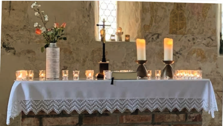
Neues Antependium (Altarbehang) in Schützberg