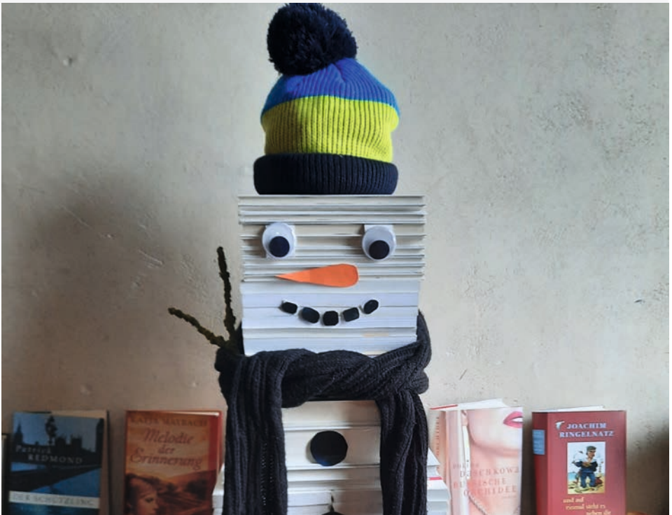
Tag des Schneemanns in der Bücherkirche