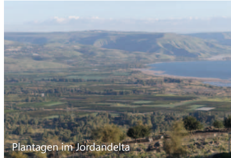
Plantagen im Jordandelta

Gast. Sie hat ihre Wurzeln in der charismatischen Erneuerungsbewegung der katholischen Kirche und ein Liedgut, das an Taizé erinnert. Sie empfangen Gäste aus der ganzen Welt und leben sehr bewußt Ökumene, indem sie ein gutes Miteinander mit anderen Christen & zur Bevölkerung der Region suchen.