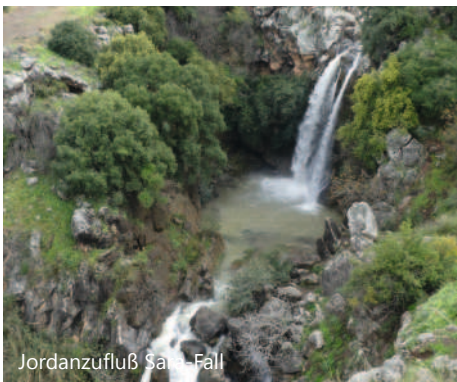
Jordanzufluß Saia – Fall

Anders als bei früheren Reisen lautete aufgrund von gesundheitlichen Einschränkungen diesmal das Motto „weniger ist mehr“. Doch gerade dadurch war einfach mehr Zeit, das Land auf sich wirken zu lassen und für Gespräche mit den Menschen dort. Die Israelis sind nämlich gern für einen Plausch zu haben und überhaupt recht offen, hilfsbereit & interessiert. Da viele ihre Wurzeln in anderen Ländern haben, kann man sich manchmal an einem Tag in 3 – 4 Sprachen unterhalten und so etwas über die Ursprungs- oder Subkultur in Israel erfahren.