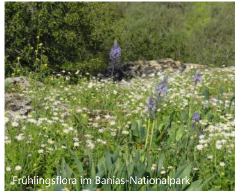
Frühlingsflora im Banias-Nationalpark

Im Frühjahr ging für mich ein langgehegter Wunsch in Erfüllung: und zwar konnte ich zusammen mit meiner Mutter für mehrere Wochen nach Israel reisen. Als Rucksacktouristen erkundeten wir von Eilat im Süden bis zum Jordanquellgebiet im Norden Nationalparks & die herrliche Frühlingsflora. Logiert wurde v.a. in Hostels & Kibbuzim, die Dank dem gut ausgebauten (Überland)Bus-system meist gut zu erreichen sind. Mehrere Male schickte Gott uns in entlegenen Gegenden menschliche Engel vorbei, damit wir an unserem Ziel ankamen.