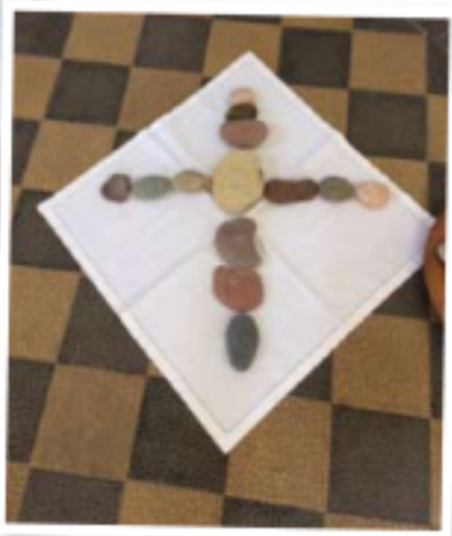
Offene Kirche in Dautzschen