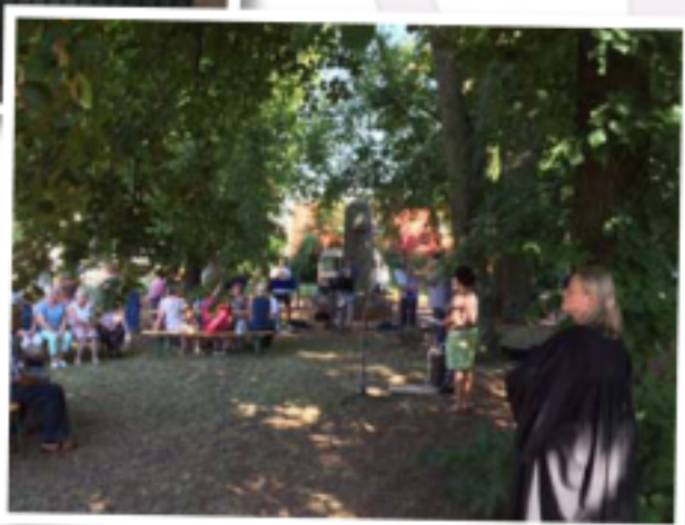
Bekrönung in Großtreben