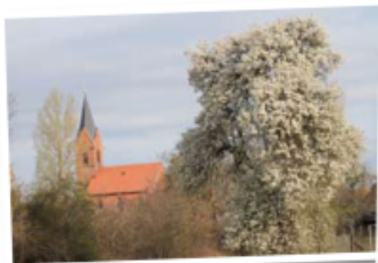
Ostern in Hohndorf