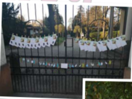
Ostern in Prettin